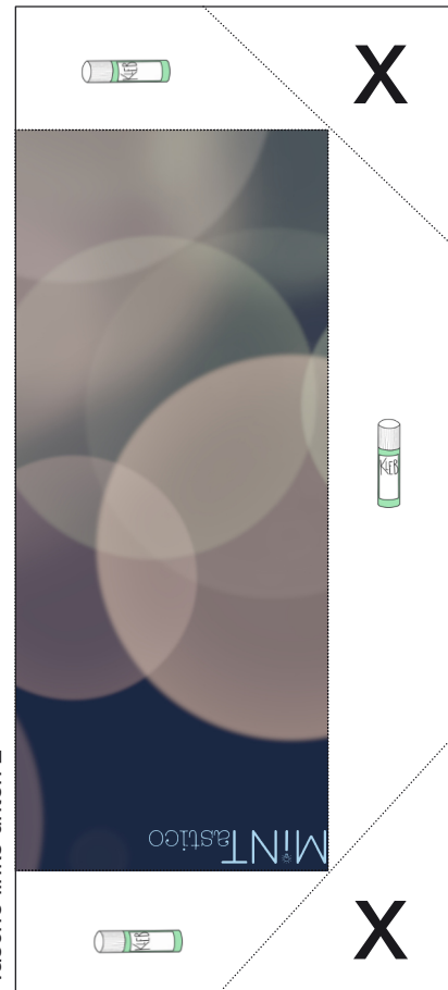
Tasche links unten 2