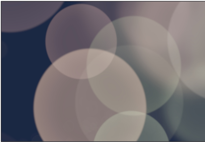
Tasche links unten 1